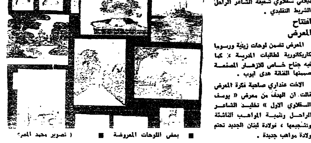
بعض اللوحات المعرضة